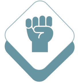
المنظمات غير الربحية