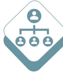
قيادات القطاع غير الربحي