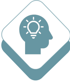
مبادرة خبراء جود