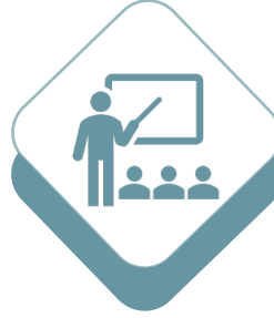
مبادرة جود للتدريب